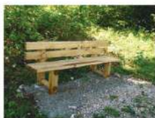
Petits mobiliers en bois