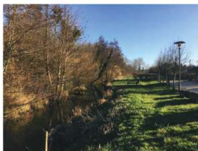
2 la rivière et un espace naturel au cœur du village