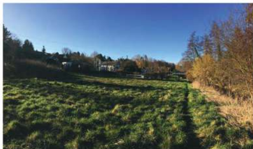
1 Un terrain en pente, des berges abruptes