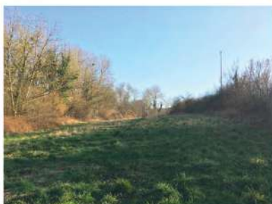
4 des écosystèmes variés